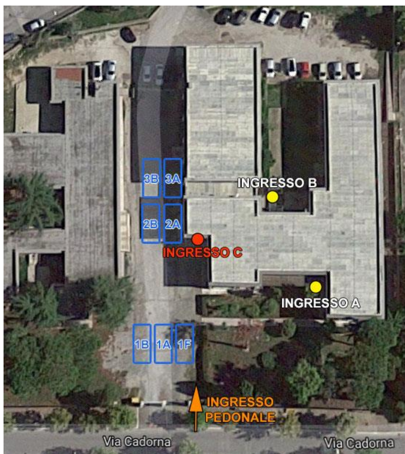
Immagine 1 – Aree di raccolta studenti per l'ingresso

Per l'accesso alla Scuola Secondaria di I Grado "A. Sebastiani" di Minturno, gli alunni dovranno posizionarsi nell'area di raccolta riservata alla propria classe alle ore 8.13, così come illustrato in immagine 1 .