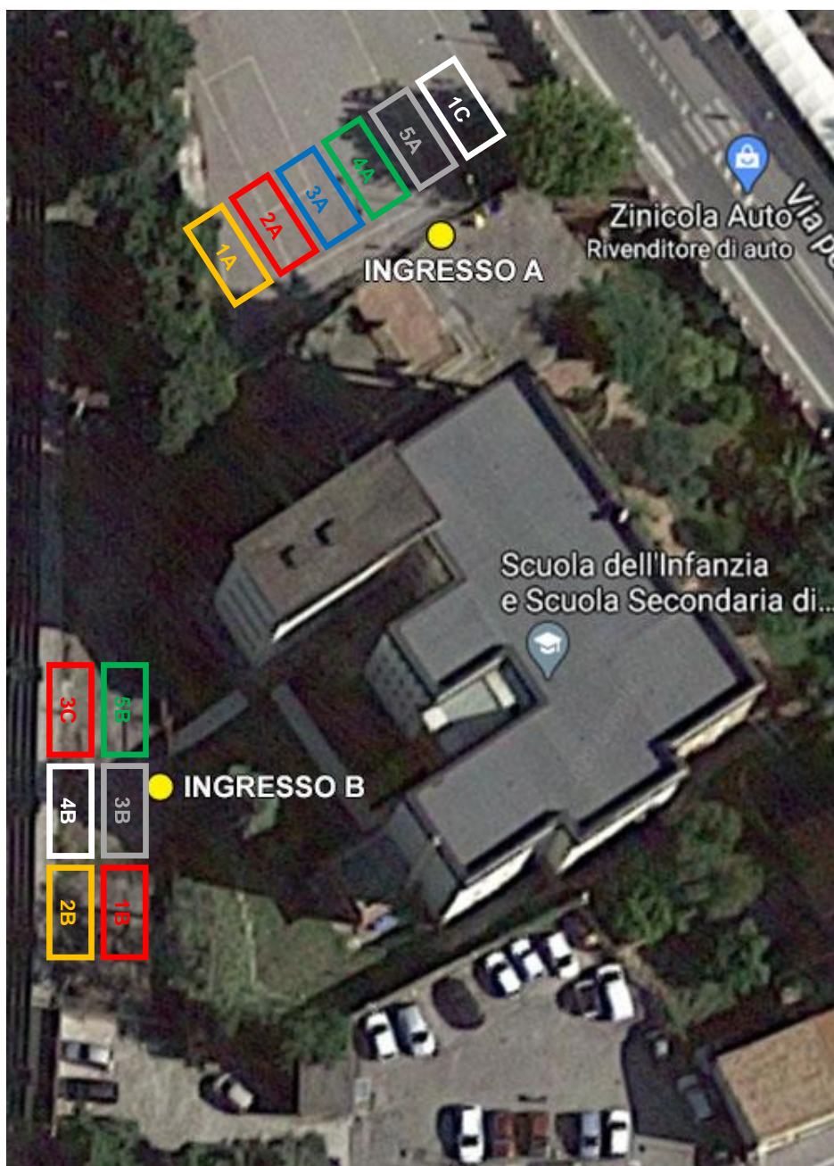
Immagine 1 – Aree di raccolta studenti per l'ingresso

Per l'accesso alla Scuola Primaria "Mons. S. Fedele" di Minturno, gli alunni dovranno posizionarsi nell'area di raccolta riservata alla propria classe e contraddistinta da un colore, così come illustrato in immagine 1 . Da via Diaz (ingresso A) accederanno le classi del corso A e la 1 ^ C, a partire dalle ore 8.08; da via L. Cadorna (ingresso B) accederanno le classi del corso B e la 3 ^ C, a partire dalle ore 8.13.