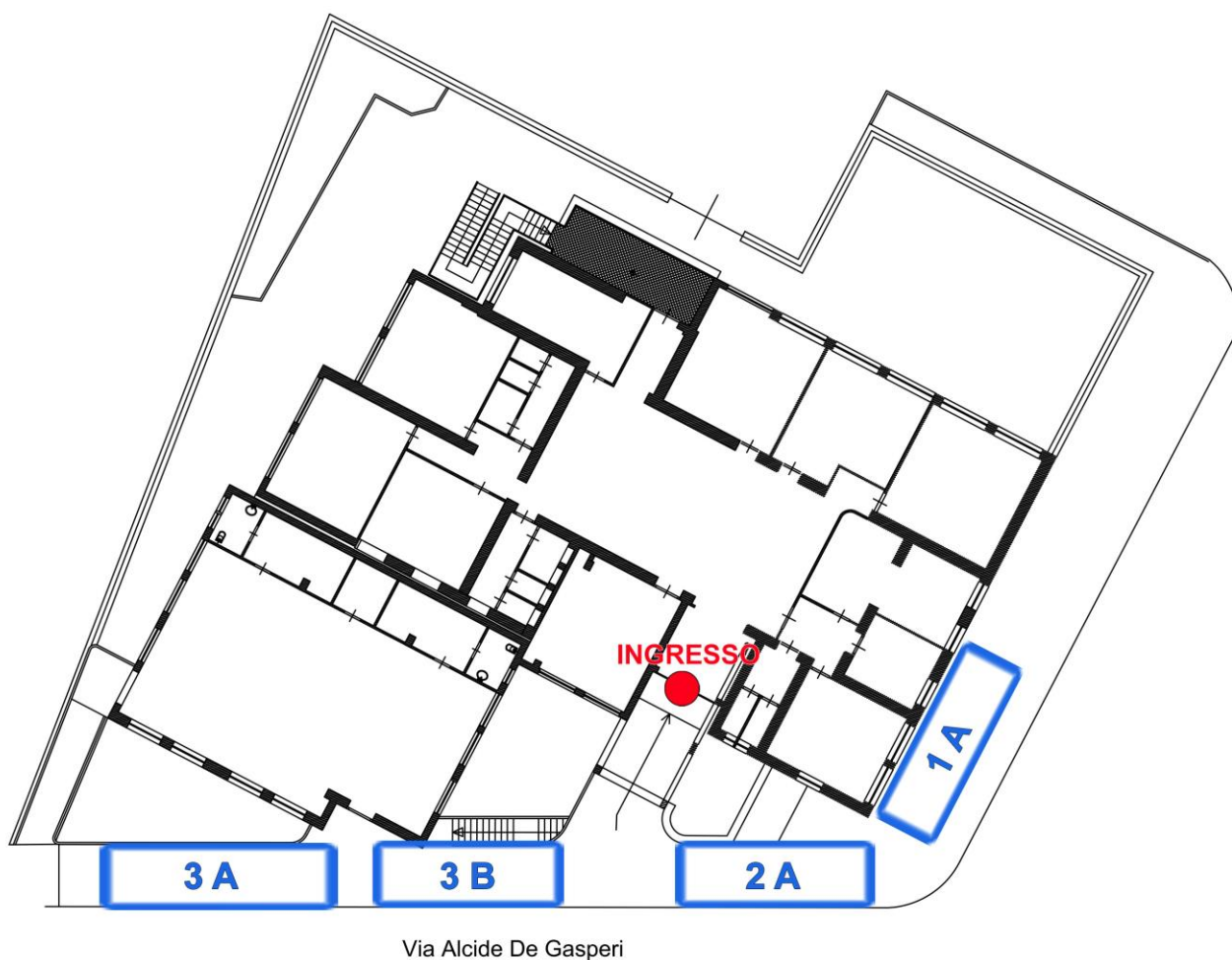
Immagine 1 – Aree di raccolta studenti per l'ingresso

Per l'accesso alla Scuola Secondaria di I Grado di Spigno Saturnia, gli alunni dovranno posizionarsi alle ore 8.08 nell'area di raccolta riservata alla propria classe, così come illustrato in Immagine 1 .